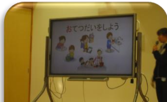
「冬休みに入る会」でお話された「やくそく」覚えているかな？